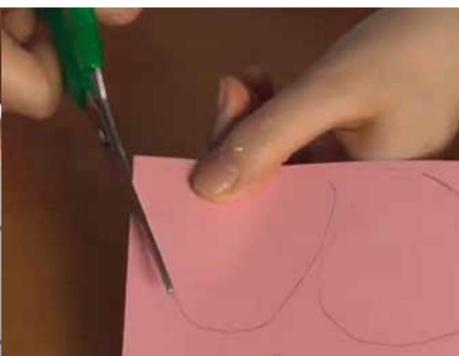
Retalla les orelles.