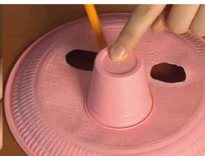
Marca on va el morro (got) i enganxa'l.