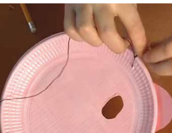
Liga una goma elàstica a cada banda de la màscara a uns forats que has fet a cada cantó.