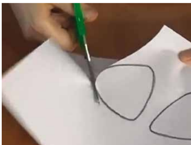
Dibuxa unes orelles a la cartolina.