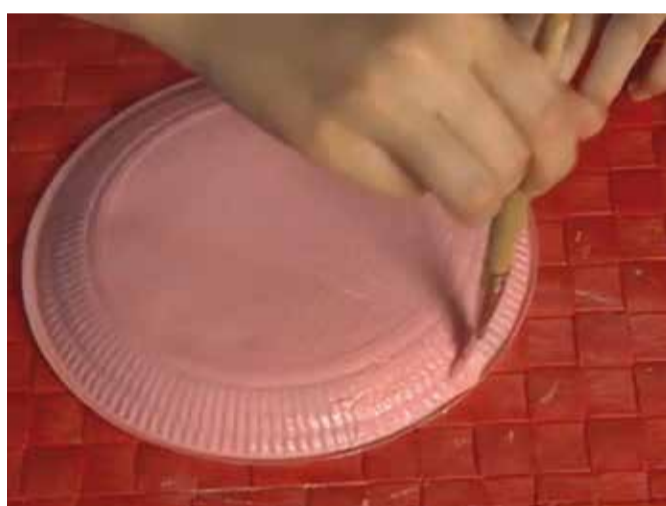
Pinta el plat i el got de plàstic de color .