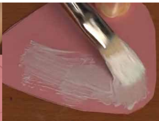
Posa la cola blanca a les orelles