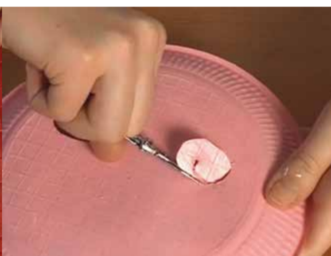
Marca amb el llapis on van els ulls i talla'ls amb les tisores.