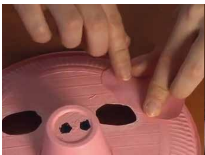
Enganxa les orelles al costat dels ulls.