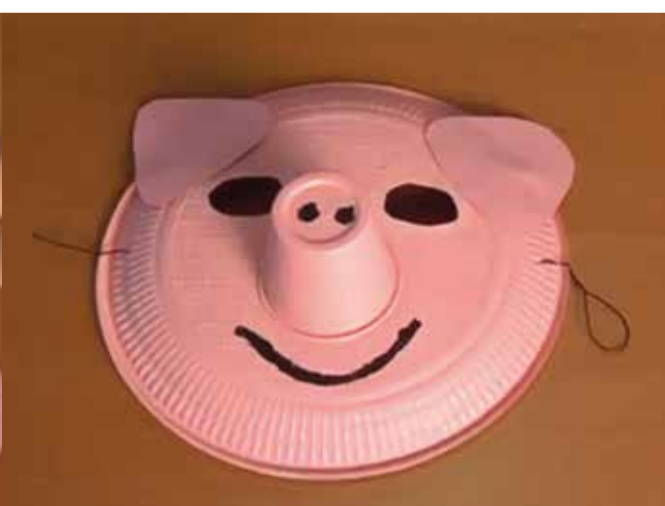
Ja tens la màscara de porquet!